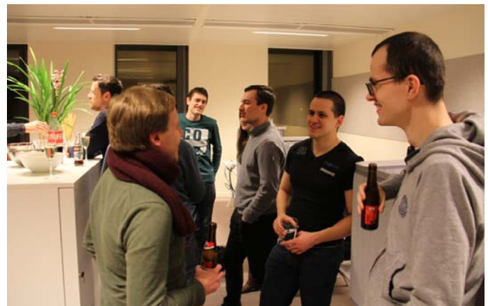
Sfeerbeeld Passwerk Café in Hasselt

Naar goede gewoonte werden recent twee Passwerk Cafés georganiseerd. Zowel op het kantoor in Berchem als in dat van Hasselt werden alle Passwerkers uitgenodigd om gezellig samen te eten en wat bij te praten. Op die manier hebben de Passwerkers de gelegenheid elkaar te ontmoeten, werkervaringen uit te wisselen en ook kennis te maken met de andere jobcoaches en de directie. Aan de lachende gezichten te zien, viel het concept ook deze keer volop in de smaak!