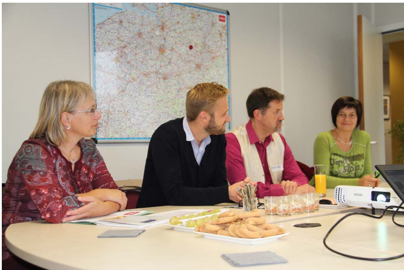
Informatiesessie voor bedrijven tijdens open dag in Antwerpen

Voor de aanwezige geïnteresseerde bedrijven werd telkens een aparte informatiesessie georganiseerd. Een getuigenis door een klant over de samenwerking met Passwerk, een getuigenis van een Passwerker zelf en een presentatie rond de jobcoaching vormden deze sessies. Een extra woordje uitleg over het recent opgerichte zusterbedrijf TRPlus kon niet ontbreken.