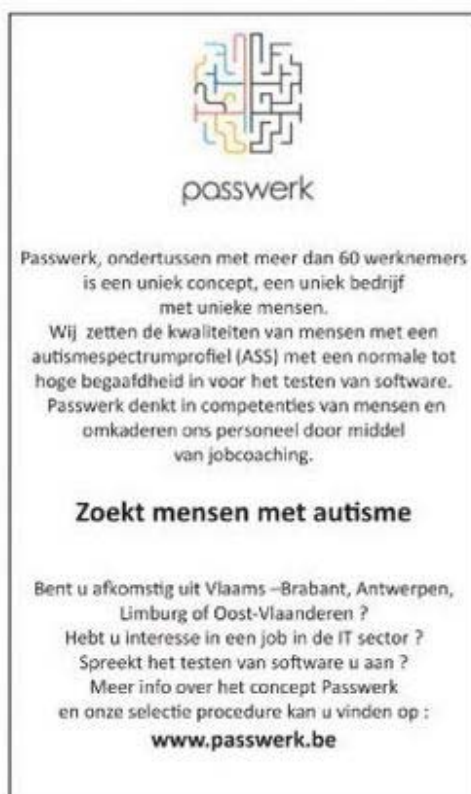
Advertentie verschenen in Metro

Voor het assessment dat halweg januari werd opgestart en waarvan de uitstroom begin maart wordt verwacht, werd bovendien een personeelsadvertentie in het gratis dagblad Metro geplaatst. In de edities van 6, 9, 12 en 13 december verscheen de hieronder afgebeelde advertentie. Begin januari verscheen nog een bijkomende advertentie in de Zondagskrant. Achteraf bekeken bleek deze strategie de juiste!