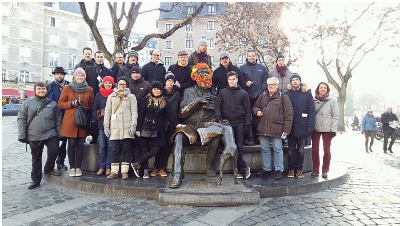
Groepsfoto aan het standbeeld van Karel Buls op de Grasmarkt in Brussel